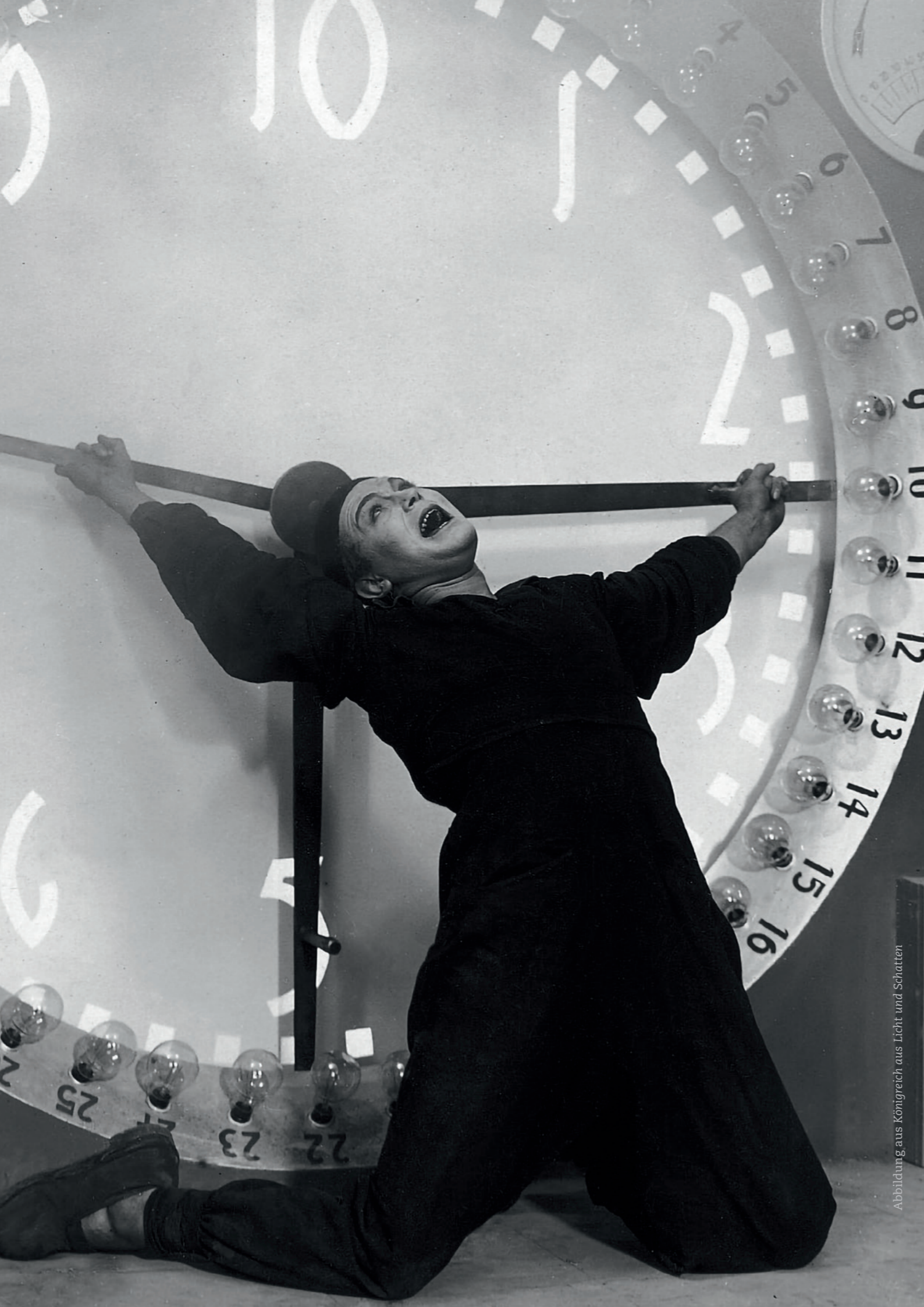
Abbildung aus Königreich aus Licht und Schatten