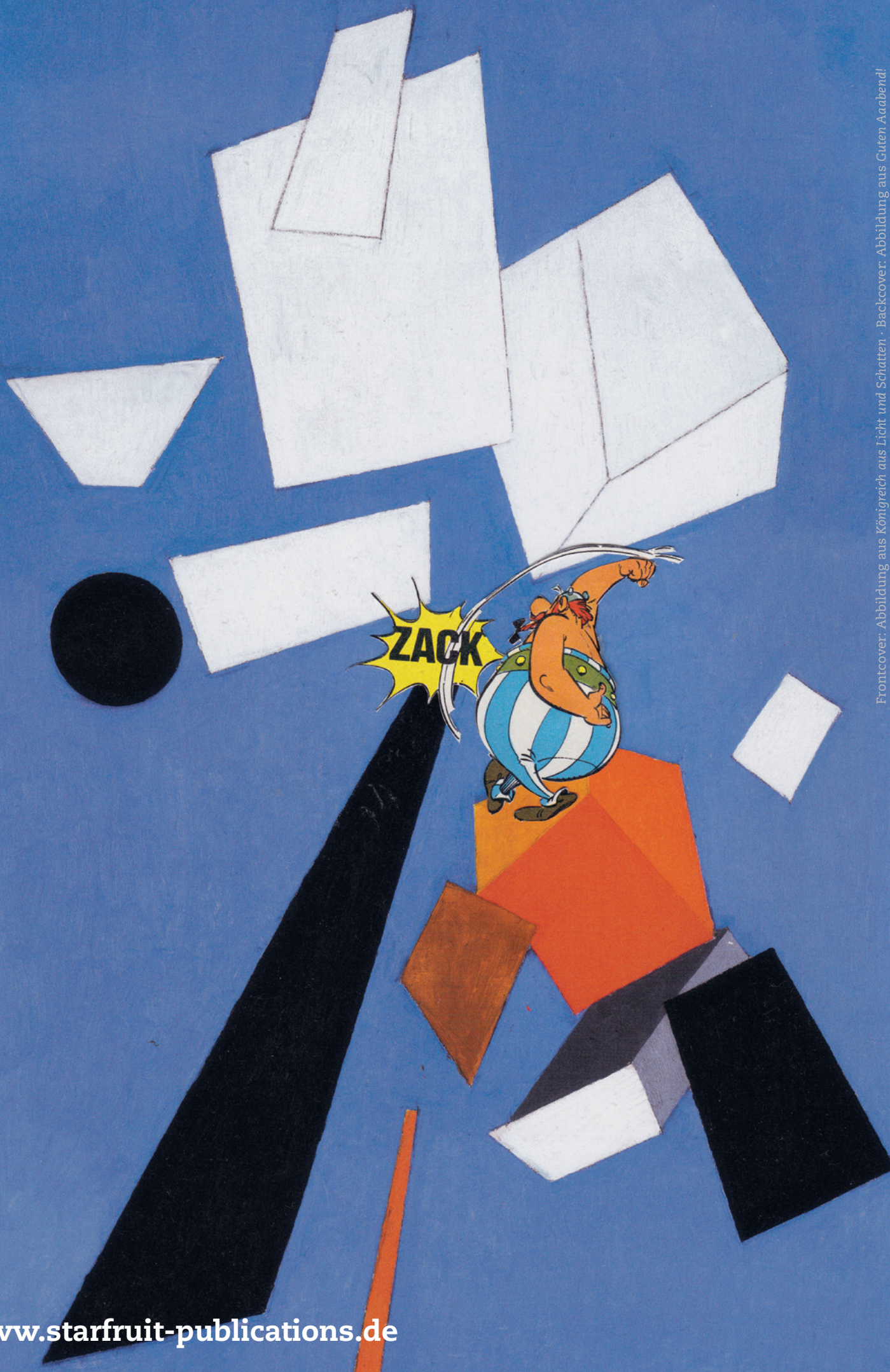
Frontcover: Abbildung aus Königreich aus Licht und Schatten · Backcover: Abbildung aus Guten Abend!